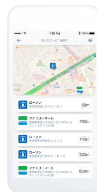
お近くのコンビニ検索 (画像はiOS版のものとなります)